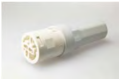
LCS 75/ 3-2

terminal block, 3 pole, housing hole diameter: M20, voltage rating: 250 V, current rating: 16.0 A, cross-section rating: 2.5 mm 2