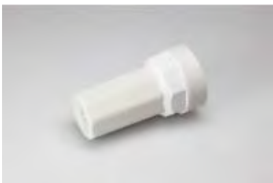
ABK 75/ 5

protective cap, 3 pole, housing hole diameter: M20