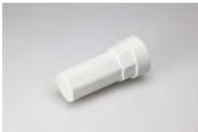
ABK 75/ 3

terminal block, 5 pole, housing hole diameter: M25, voltage rating: 400 V, current rating: 16.0 A, cross-section rating: 2.5 mm 2