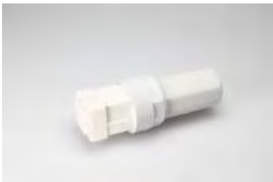
LCS 75/ 5

terminal block, 2 pole, housing hole diameter: M20, voltage rating: 250 V, current rating: 16.0 A, cross-section rating: 2.5 mm 2