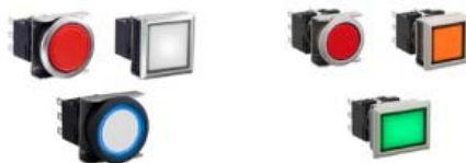
LBW 22mm Flush Mount

En esta aplicación se utilizaron los siguientes productos: