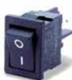
Serie 8500: 13x19mm, sp, dp, ilum. 10(6)A-250Vac