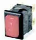
Serie 8300: 13x19mm actuador personalizado, 16(4)A-250Vac 10(4)A-250Vac