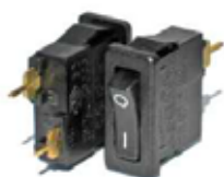
8800 'X' Terminal Interruptor basculante 9,5x21 con terminales a circuito impreso serie X8800