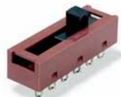
2000: Deslizantes hasta 5 pos. 10A/250Vac