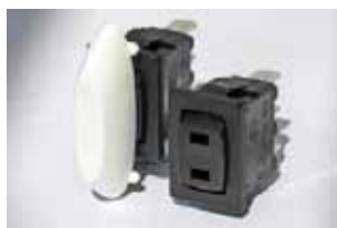
8600 'H' Rocker: Interruptor basculante 15x21 con ranuras para actuadores personalizados serie 8600H