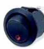
R13: 20.2mm, sp, dp, iluminado, 10(4)A-250Vac