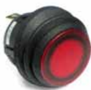
Serie R13 IP65 Interruptor basculante luminoso redondo diám. 19 mm. Estanco