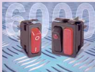
Serie 6000: 11x30 y 22x30mm, sp, dp, ilum., IP67: 16(4)A-250Vac, inrush 150A