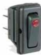
Serie 6100 IP67: Interruptor basculante luminoso 11x30 y 22 x30 con estanqueidad interna