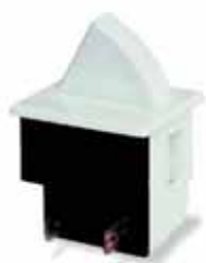
0055/3100: Int. Puerta de nevera Splashproof /explosion proof