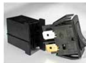
Serie 1250 Connector Block Conectores para interruptores serie 1250