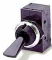
Serie 1700: actuador de palanca