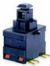
8200: actuador a medida, 16(4)A-250Vac