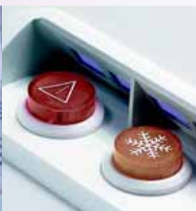
Serie 7000: 25 mm, sp, dp, ilum., 16(4)A-250Vac