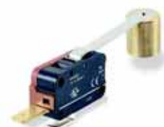
Serie 0320: Interruptor de Seguridad - 16A-250Vac