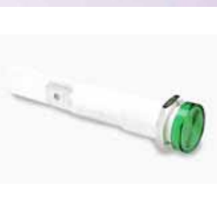
Pilotos: Neon, LED y lámpara filamento, con protección Ip67