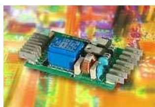
Control electrónico para campana extractora de cocina