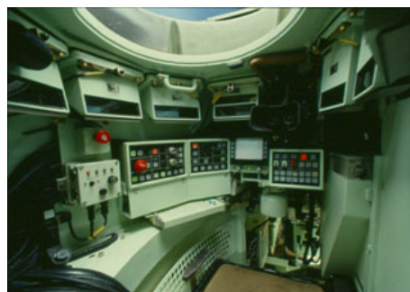
Teclados específicos , interruptores 12000 & capuchones de seguridad. Tableros de mando de carros de combate