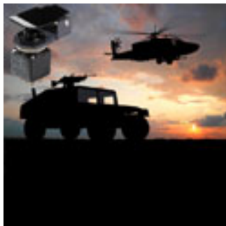
Capuchones de seguridad Defensa , máquinas militares